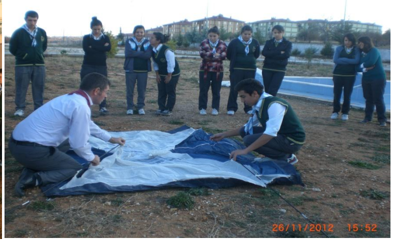
Çadır kurmayı öğrendik.