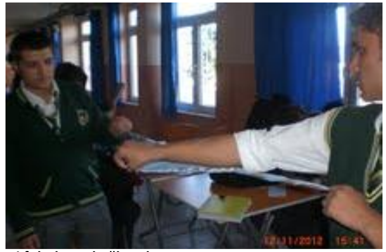
İzcilerimiz, çalışma öncesi fularlarını bağıyorlar.