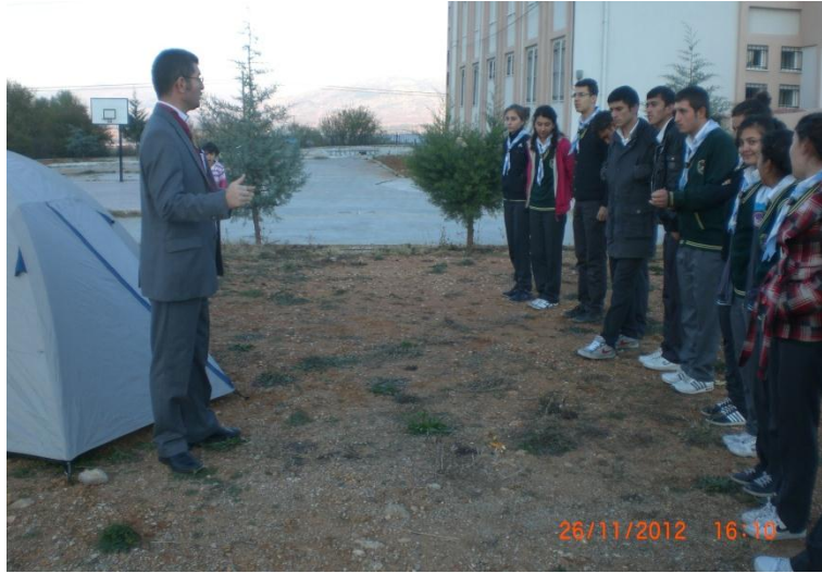
Çadır kurmanın yöntemini ve tekniğini öğrendik. İyi gerdirilen bir çadır, konforlu bir kamp uykusu demektir.