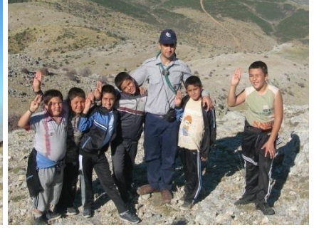
İzci kardeşlerimizden haber var...

Çal-Akkent Cumhuriyet Ortaokulu Akkent İzci Oymağı