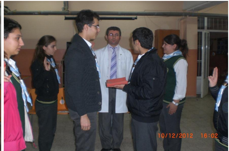
Ekipler arasında bayrak devir teslimi yaptık. Bayrak devir teslimi, dikkat :

-Şerefiyle koruduğum bayrağımı teslim ediyorum ! - Şerefiyle koruyacağım bayrağımı teslim alıyorum !